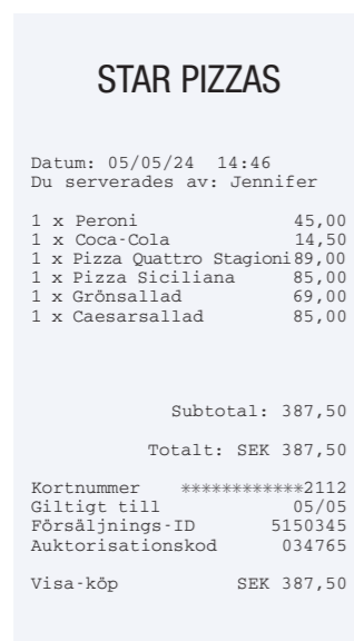
Exempel på kvitto med inbyggda typsnitt