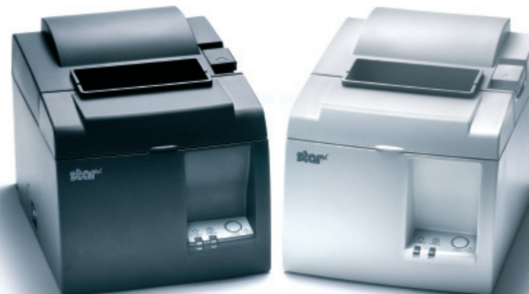
USB-gränssnitt för hög-hastighetsöverföring med valbar serieportemulering