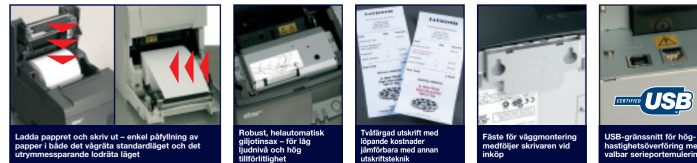
Ladda pappret och skriv ut – enkel påfyllning av papper i både det vägräta standardläget och det utrymmessparande lodräta läget

Resultat vid utskrift av 80 mm brett x 150 mm långt kvitto med Microsoft Windows XP på en dator med 2,3 GHz CPU och 512 Mbyte RAM